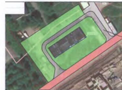
Ситуационный план М 1:14000