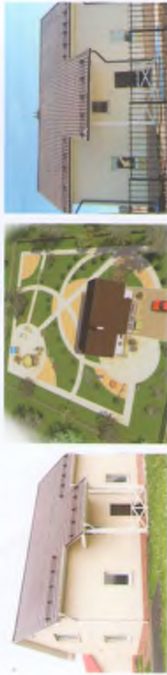
ТИП 3 - двухэтажный дом, общая площадь 125,49 м 2

Вокруг цивилизация, а не «голое поле»! Расположение вблизи села Култаево – несомненный плюс «Южного ветра». Здесь есть общеобразовательная школа, детская школа искусств, детские сады и центры развития, медицинские учреждения. Магазины, спортивный комплекс, спортивные секции для детей и взрослых. Благоустроенный пруд, на берегу которого можно отдохнуть, позагорать и поиграть в пляжные игры!