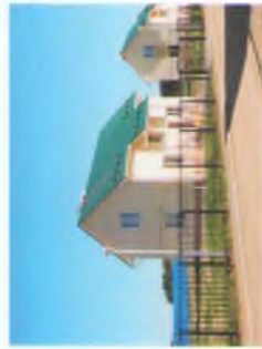
ТИП 2 - двухэтажный дом, общая площадь 106,14м 2