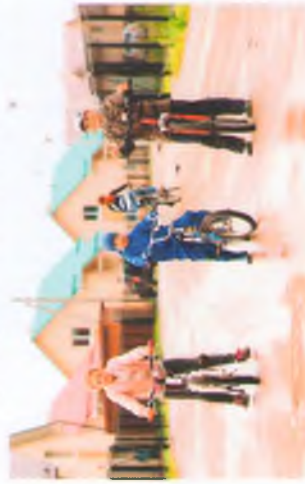
Фотографии окрестностей поселка «Южный ветер»

Узнайте, как сэкономить на коммунальных платежах! Демонстрационный дом в поселке "Южный ветер" с современными технологиями энергосбережения. /342/ 207-29-70 | www.TVK-SETI.ru