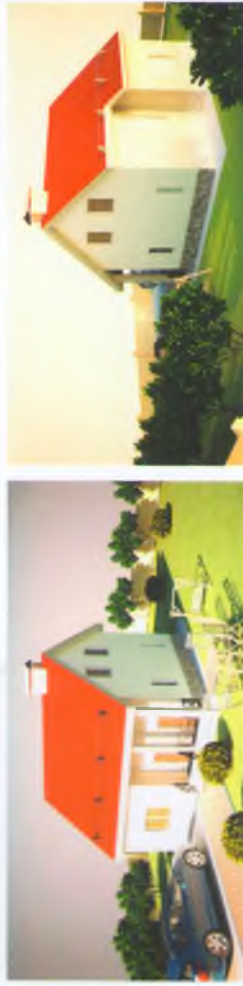
ТИП 4 - двухэтажный дом, общая площадь 180,00 м 2

Стоимость коттеджей в «Южном ветре» начинается от 3,9 млн. рублей. Эта цена включает: кирпичный загородный дом, земельный участок 10 соток, чистовую отделку дома «под ключ», централизованные коммуникации При 100% оплате предоставляется скидка от 1 до 4 %. Скидка 1000 руб/кв.м при покупке дома без отделки.