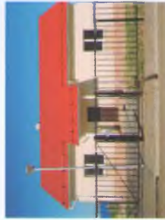
ТИП 1 - одноэтажный дом с мансардным этажом, общая площадь 90,26 м 2